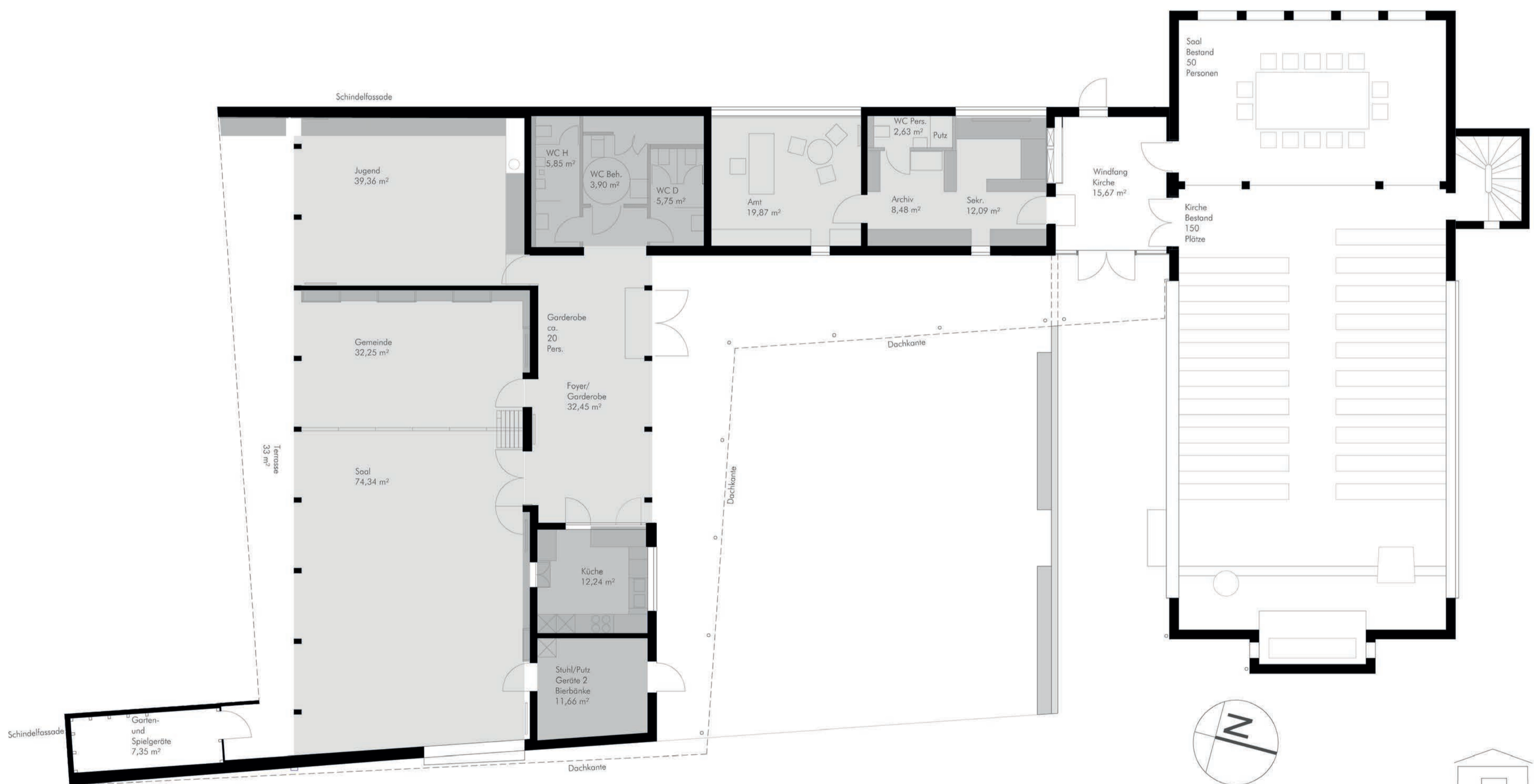
Grundriss M 1:100

Das Gebäude wird Holzständerbau in Rahmenbauweise ausgeführt. Die Rahmenelemente für Wände und Decken bestehen aus Konstruktionsvollholz mit beidseitiger Beplattung aus OSB und DWD-Platte und einer Isoflockfüllung. Die Vordächer sind aus sechs cm starken Bohlen auf einer Stahl-Unterkonstruktion. Das Gebäude erfüllt den Niedrigenergiestandard.