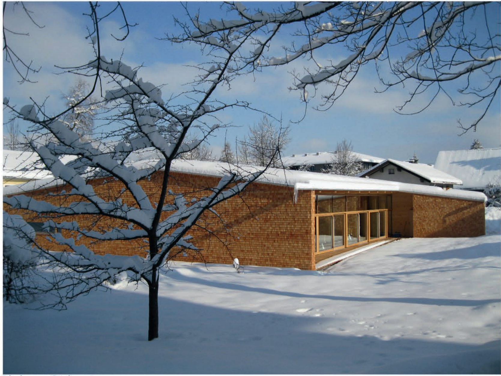
Blick von Südwesten