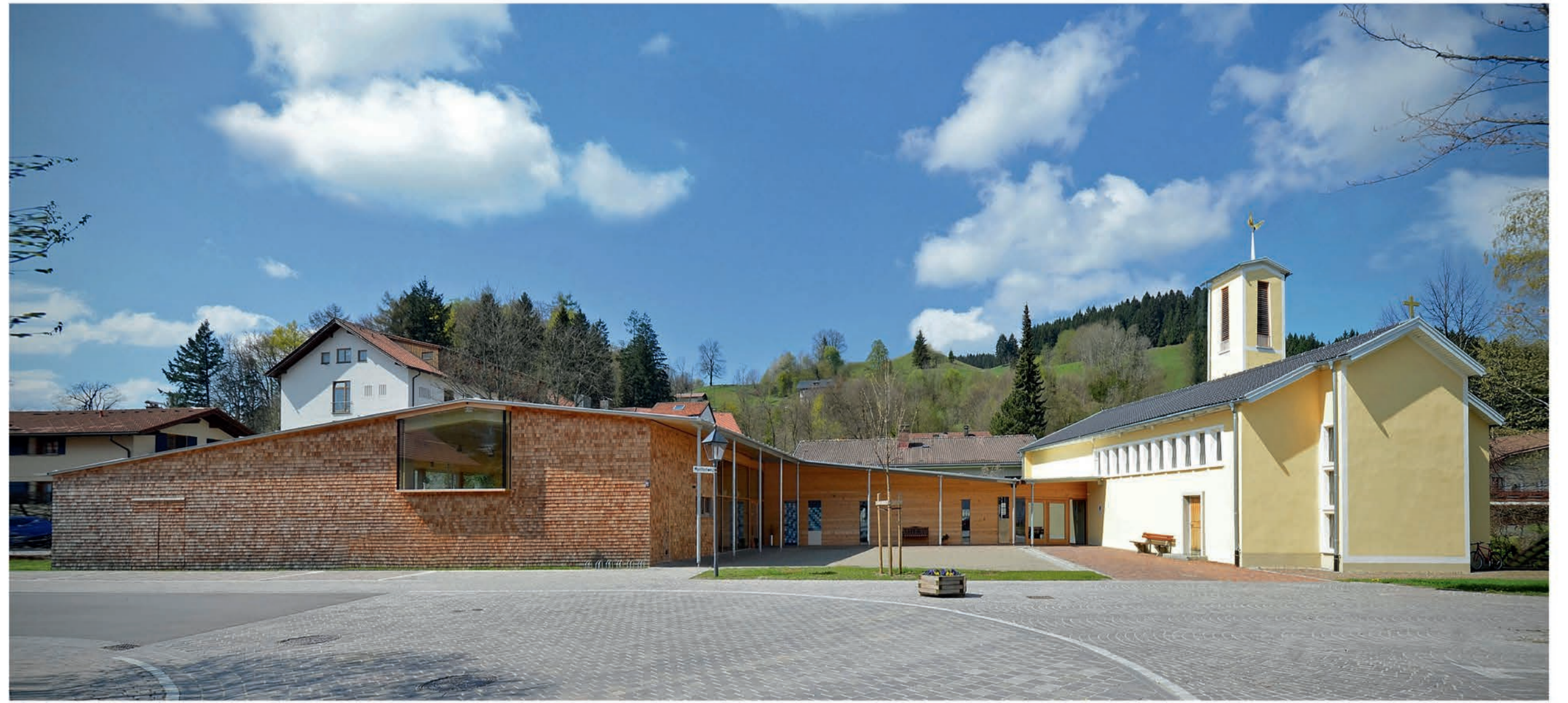
Blick von Nordosten