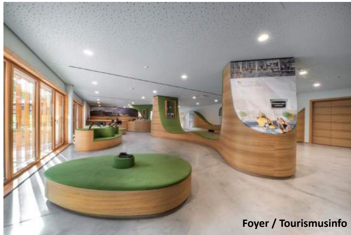
Foyer / Tourismusinfo

Im neuen Nutzungskonzept bilden die Mehrzweckhalle in der ehemaligen Schwimmhalle, die neue Tourismus-Information mit einer Almenausstellung und eine Kinderkrippe die Hauptnutzungen. Im Obergeschoß befinden sich noch Vereinsräume für Schützen- und Trachtenvereine sowie Seminar- und Schulungsbereiche.